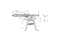
SIRINGA ROUX N° 19 molla fermo dente